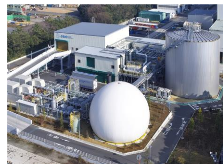
食品廃棄物 メタン発電施設 「Jバイオ横浜工場」