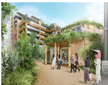
環境サステナブル発信拠点 「フォレストゲート代官山」